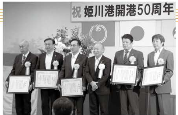
記念式典 表彰式の様子

6月2日(金)の記念式典では、港湾整備などにご尽力いただいた方々への表彰等が行われました。また、開港50周年を記念し、8月には帆船「日本丸」、海上自衛隊の掃海艇「ひらしま」、上越海上保安署の巡視艇「たつぎり」が姫川港に寄港しました。寄港中は、船内の一般公開や、ひめかわみなとマルシェなどが行われました。